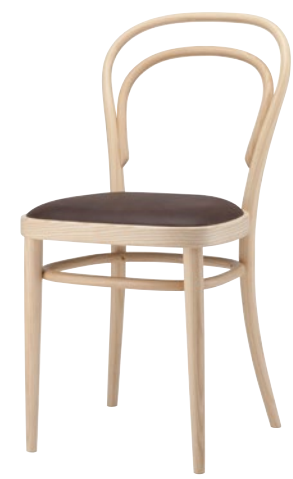
214 P SITZ MIT SPIEGELPOLSTERUNG/ SEAT WITH TACKED-ON FLAT UPHOLSTERY