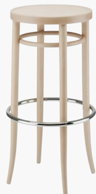
204 MH MULDENSITZ/ MOULDED PLYWOOD SEAT