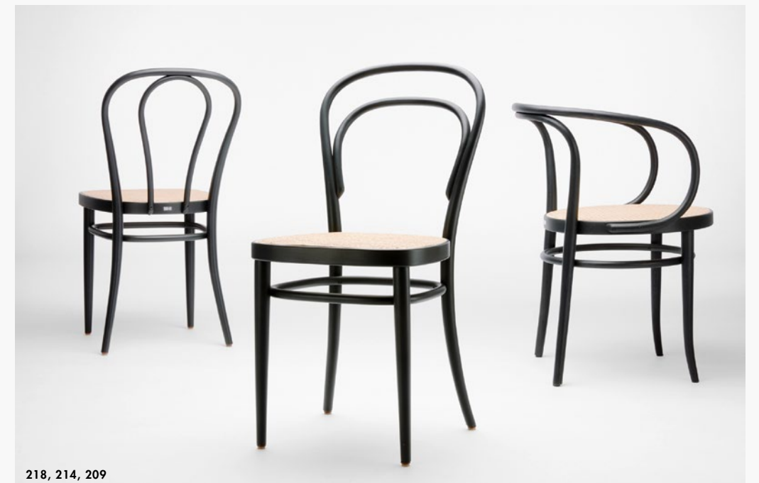
218, 214, 209

EN The famous coffee house chair is an icon and considered the most successful mass-produced product in the world to date: it initiated the history of modern furniture. The basis was a new technique – the bending of solid wood – that Michael Thonet developed and perfected during the 1850s, and it was the first time serial furniture production was possible. And then there was an ingenious distribution model: 36 disassembled chairs could be packed into a one cubic metre box, shipped throughout the world and then assembled on site. With its clear, reduced aesthetics, this classic has been used in a wide variety of settings for more than 160 years.