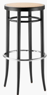
204 RH ROHRGEFLECHT, MIT KUNSTSTOFFSTÜTZGEWEBE/ CANEWORK, WITH SUPPORTING SYNTHETIC MESH