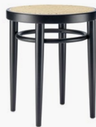
214 RH ROHRGEFLECHT, MIT KUNSTSTOFFSTÜTZGEWEBE/ CANEWORK, WITH SUPPORTING SYNTHETIC MESH