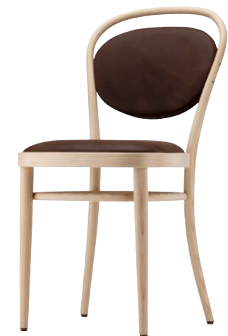
215 P SPIEGELPOLSTERUNG/ TACKED-ON FLAT UPHOLSTERY