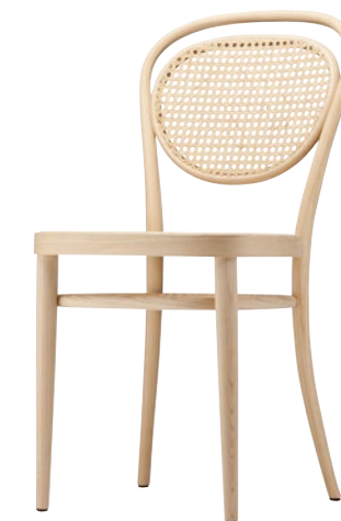
215 R ROHRGEFLECHT/ CANEWORK