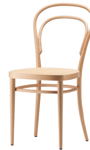
214 M MULDENSITZ/ MOULDED PLYWOOD SEAT