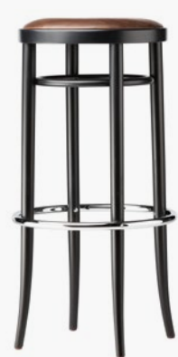
204 PH SITZ MIT SPIEGELPOLSTERUNG/ SEAT WITH TACKED-ON FLAT UPHOLSTERY