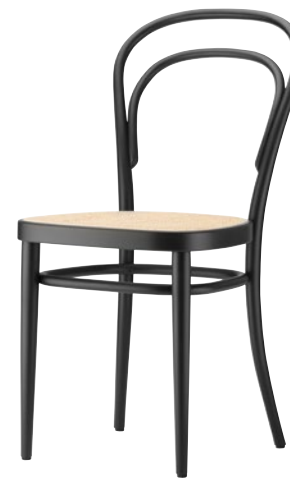
214 ROHRGEFLECHT/ CANEWORK