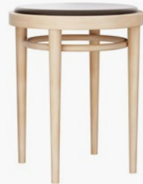
214 PH SITZ MIT SPIEGELPOLSTERUNG/ SEAT WITH TACKED-ON FLAT UPHOLSTERY