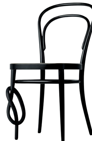
214 K MIT KNOTEN/ WITH KNOT